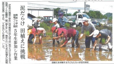
6月4日伊豆日日新聞掲載

5月に稲まきをし、この日は田植えを行いました。初めて水の入った田んぼに入った子ども大勢おり、まずはその泥の感触を楽しむ姿が見られました。実際の田植え体験では、「こんなに小さい苗から、お米ができるまで育つの?」「いつも食べているお米って、こんなに苦労して作られているの?」と、話しながら、1列ずつ並んで植えていきました。