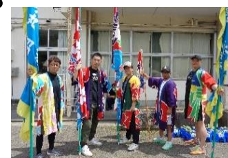
ご協力いただいた 保護者の皆様