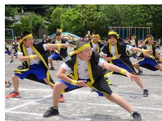
ソーランの一場面

を目指しています。運動会の子どもの姿を見て、このねらいを多くの子どもたちが概ね達成できたのではないかと考えています。運動会で学んだことをこれからの学校生活に生かすことができればと願うばかりです。