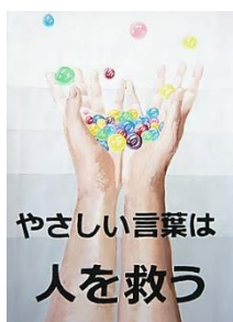
平成30年群馬県 いじめ防止 ポスター入賞作品

ご家庭でも子どものことに関して心配なことがございましたら、いつでも学校に連絡をください。今後もよりよい学校づくりへのご支援をお願いいたします。