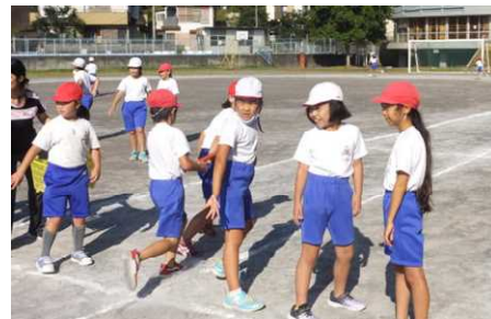
【朝運動を頑張る子ども】

コロナ禍の状況下ではありますが、2学期は大きな行事(運動会、持久走大会、修学旅行、自然体験教室など)が控えています。行事によって子どもたちが大きく成長してきた姿を今まで数多く見てきました。行事は子どもたちを成長させてくれる大事なものです。コロナウイルスの心配がありますが、子どもたちのためにも、安全・安心を大前提とした上で、現時点では内容と方法を検討した上で実施の方向で考えています。今後の状況によっては行事の直前になって変更する場合も出てくるかもしれませんが、その時はご理解いただけるようお願いします。