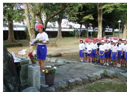
【昨年の献花の様子】

昭和33年9月26日、狩野川台風のために多くの尊い命が奪われました。熊坂地区にとっても、熊坂小にとっても忘れることができない日です。例年、9月26日は熊坂小学校では、狩野川台風にご冥加会を実施しています。昇降口前のモニュメント(1～3年生)と狩野川公園の慰霊碑(4～6年生)に献花をし、狩野川台風を経験された方にお話を聞いています。狩野川台風は発生から60年以上も過ぎ、記憶から薄れつつあります。狩野川台風の記憶を後世に伝え、そして、防災意識を高めていくことを目的としています。例年、全校児童が体育館に集まり体験された方のお話を聞いていましたが、今年度は各教室にて座談会形式で話を聞き、より自分事として捉え考える機会とすることにしました。なお、当日は土曜参観として開催します。保護者の皆様も狩野川台風世代ではないので、ぜひ一緒に話を聞いていただき狩野川台風を知り、お子さんと一緒に防災について考える機会としていただくと幸いです。